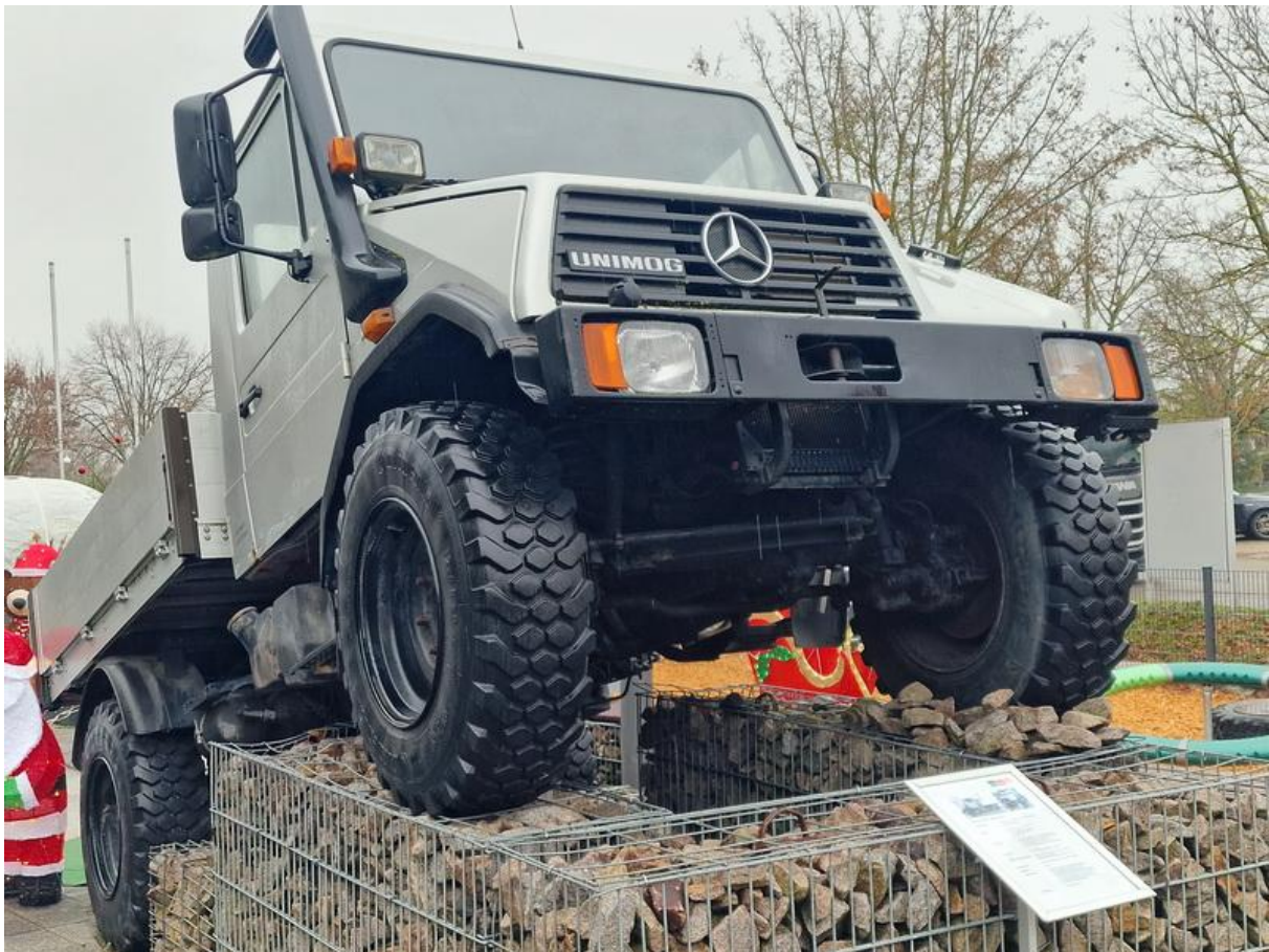
Unimog – Fahrt im Freigelände bis 100% Steigung/Gefälle (entspricht 45°)