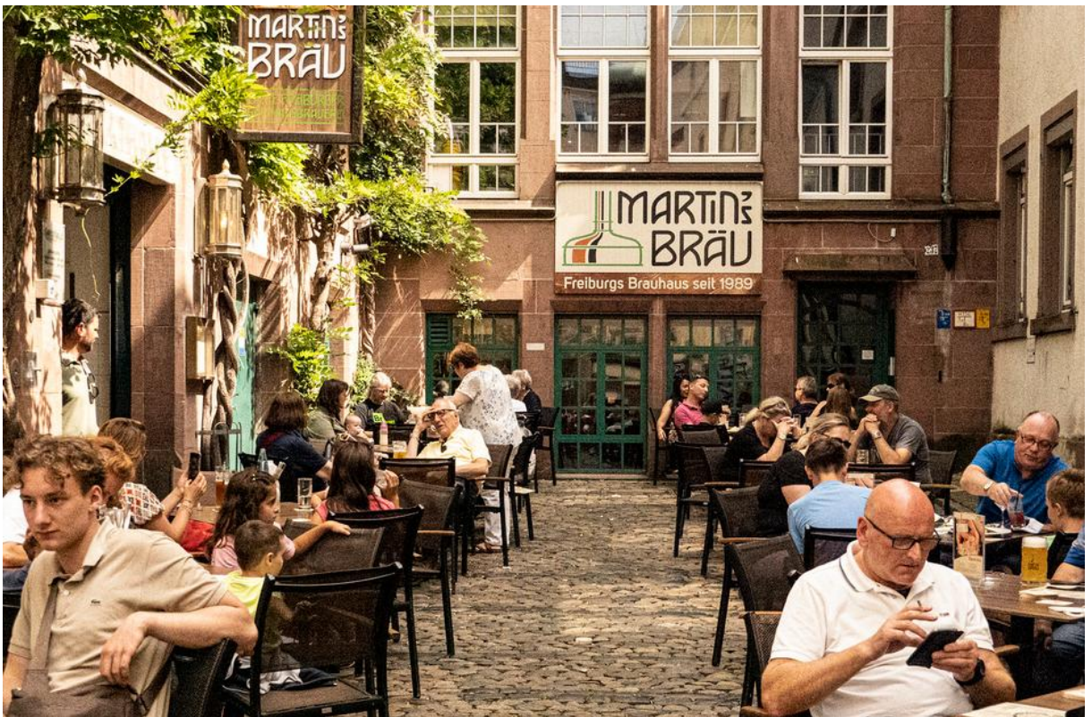
Ausklang in der Altstadt