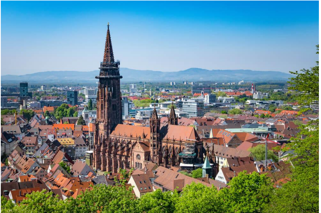
Blick zum Münster, in der Altstadt